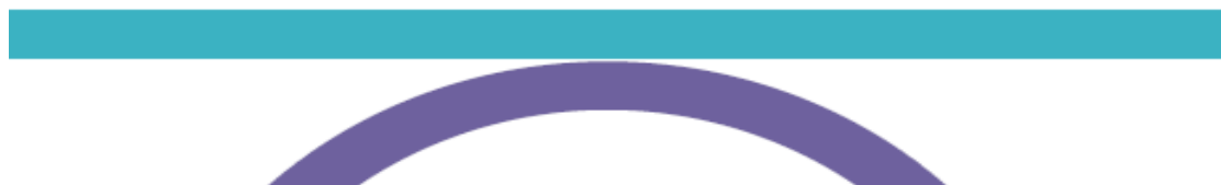
Komise pro udělování Oprávnění a Osvědčení k provádění prohlídek mostních objektů na pozemních komunikacích

P.3.1.5 KOMISE MD-prohlídky mostů používá pro účely záznamů, zápisů, protokolů či styku s MD a s jinými orgány a organizacemi vlastní barevné logo s nápisem „Komise pro udělování Oprávnění a Osvědčení k provádění prohlídek mostních objektů na pozemních komunikacích“, které je uvedeno na obr. 1.